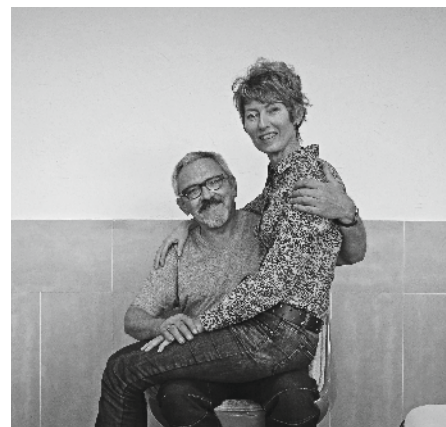
EXTRAITS DE TOUT UN MONDE ET TOUT UN LOUVRE (THIERRY MAGNIER) PAR KATY COUPRIE ET ANTONIN LOUCHARD

toujours inventer pour avoir la réponse la mieux appropriée au projet, toujours chercher des solutions plastiques, graphiques, techniques, formelles... Là, nous étions après une grande exposition Dubuffet à Paris, alors, collage, attention au détail et morcellement m'ont semblé pertinents avec l'idée, sous-jacente, qu'on est constitué de parties qui ont chacune leur importance et qui valent par leur singularité.